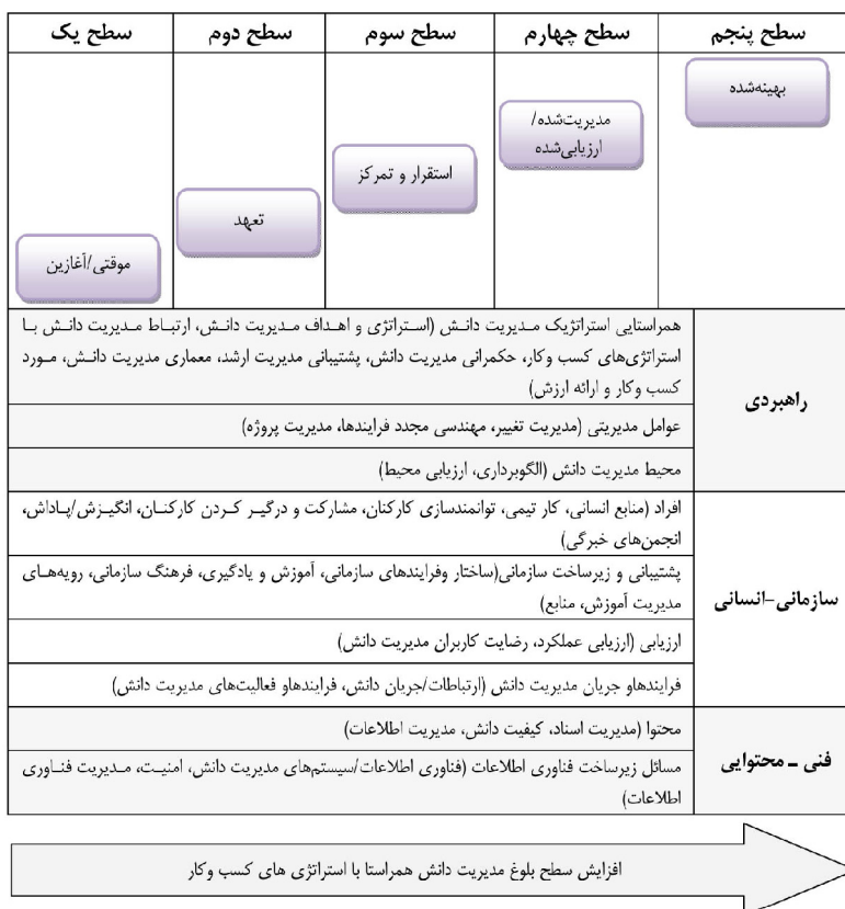
شکل ۲. مدل نهایی بلوغ مدیریت دانش همراستا با کسب و کار