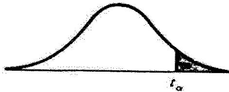
جدول توزیع t

نام درس: آمار در علوم اجتماعی رشته تحصیلی / کد درس: علوم اجتماعی (برنامه ریزی اجتماعی - تعاون و رفاه: ۱۲۲۲۱۸۴) - (مددکاری اجتماعی: ۱۲۲۲۱۴۲) زمان آزمون (دقیقه): تستی: ۶۰ تشریحی: ۶۰ علوم اجتماعی (تعاون و رفاه اجتماعی - پژوهشگری علوم اجتماعی: ۱۲۲۲۰۱۹) - جامعه شناسی ((جبرانی ارشد: ۱۱۱۷۱۲۰)) جامعه شناسی (توسعه - جامعه شناسی مسائل اجتماعی، حوزه مطالعات شهری صنعتی (جبرانی ارشد: ۱۲۲۲۰۱۹)) کد سری سؤال: یک (۱) استفاده از: ماشین حساب مجاز است.