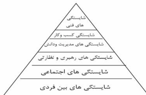
شکل (۲): مدل سلسله‌مراتب شایستگی‌های مدیریتی (وییتالا، ۲۰۰۵)

در مدل دیگری که وییتالا ۱ (۲۰۰۵) تدوین کرده، شایستگی‌ها به طور سلسله‌مراتبی در شش طبقه قرار گرفته شده است. وی این شایستگی‌ها را به صورت یک مثلث نشان می‌دهد. این مدل در شکل زیر نشان داده شده است.