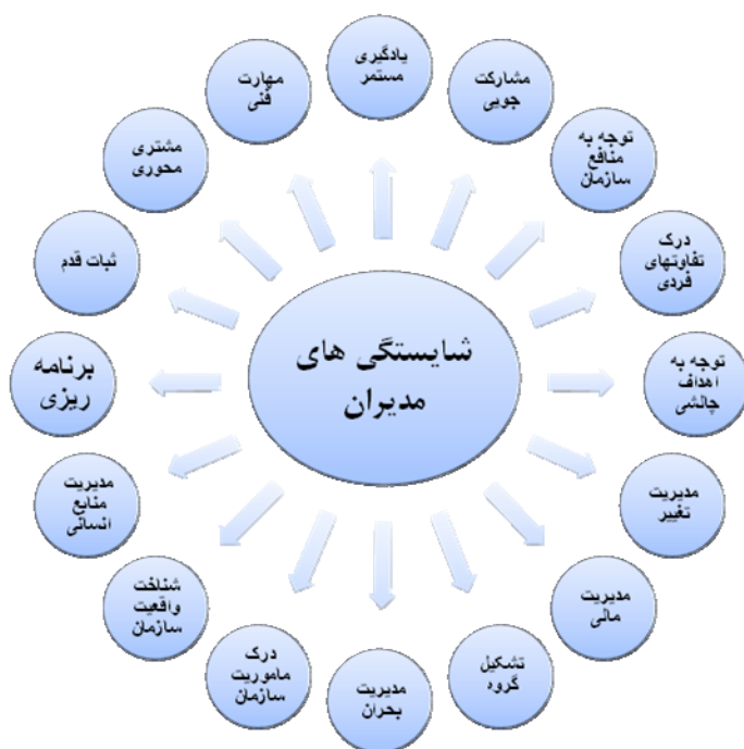
شکل (۴): مدل نهایی پژوهش