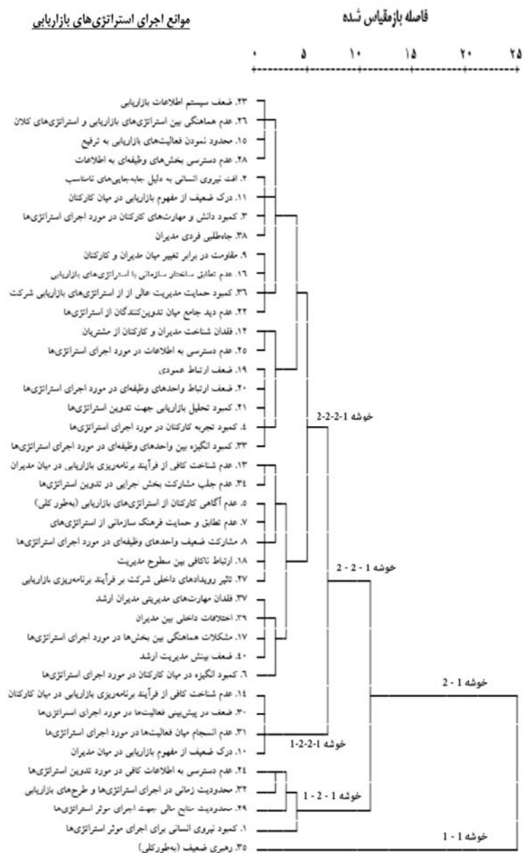
نمودار ۲. نتیجه تحلیل خوشه‌ای سلسله‌مراتبی