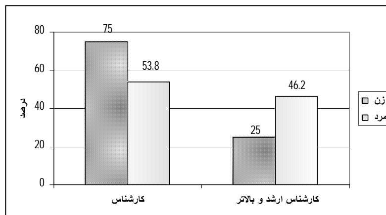
شکل ۲. سطح تحصیلات مدیران ستادی

براساس جدول ۲، از ۳۸ نفر، ۱۱ نفر (۲۹ درصد) در رشته تربیت بدنی، ۱۳ نفر (۳۴/۲ درصد) در رشته مدیریت و ۱۴ نفر (۳۶/۸ درصد) در دیگر رشته‌ها تحصیل می‌کردند. بنابراین بیشترین فراوانی مربوط به طبقه دیگر رشته‌ها بود (جدول ۲).