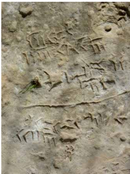
سنگ‌نبشته خارک عکس از: ر. م. غیاث آبادی، اسفند ۱۳۸۶

نداشته و از آن بهره‌ای نبرده است. در پیرامون صخره، نشان‌های میخی دیگر که گاه بسیار محو و ناخوانا هستند، دیده می‌شود.