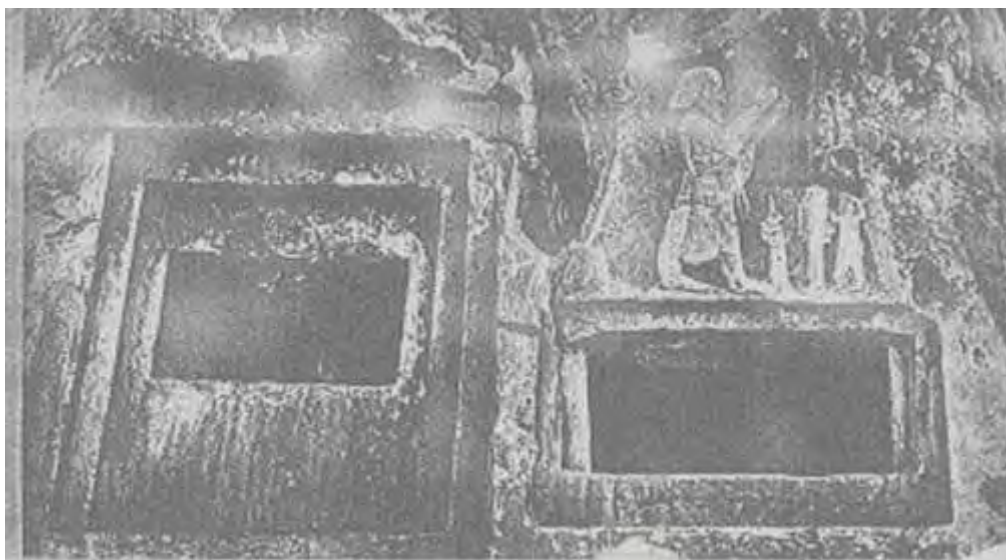
دخمه گانوماته بردیه (زرتشت) در روستای سکاوند بخش هرسین کرمانشاهان

آب زنید راه را، هین که نگار می رسد — مژده دهید باغ را بوی بهار می رسد