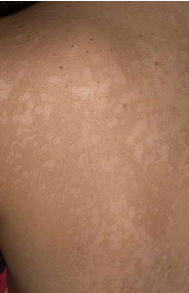
پایگاه اطلاع رسانی پوست، مو و زیبایی

رطوبت و تعریق پوست ، چاقی ، استفاده از قرصهای ضد بارداری ، حاملگی ، وراثت ، سوء تغذیه و.... اما گاهی هیچکدام از این زمینه ها نیز وجود ندارد . این بیماری ( اگر بتوان نام آن را بیماری نهاد ) را می توان با شامپوها ویا لوسیونهای ضد قارچ درمان نمود . اما معمولاً عود کننده بوده و ممکن است هر سال یکی دوبار فرد را مبتلا کند . این حالت در جوانان و افراد میانسال شایعتر از کودکان و افراد مسن می باشد . در کودکان این حالت می تواند کناره های صورت رانیز گرفتار کند وبا لکه های کمرنگی که ایجاد می کند والدین را نگران سازد .