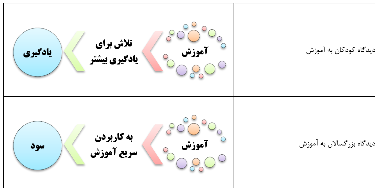
شکل ۳: مقایسه دیدگاه کودکان و بزرگسالان نسبت به آموزش

در شکل ۳ دیدگاه کودکان و بزرگسالان نسبت به آموزش باهم مقایسه شده است.